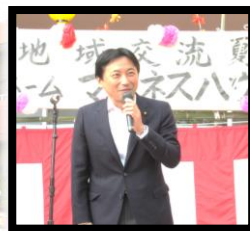
来賓挨拶 衆議院議員

今年も、天候に恵まれ、夏祭りを行なうことができました。会場は地域の方々やご家族と大変な賑わいで、盛大な夏祭りを執り行うことができました。祭りのフィナーレで打ち上げ花火も上がり大変盛り上がりしました。 毎年、たくさんのご支援とご協力をいただきまして、大変ありがとうございました。楽しい夏祭りでした♪